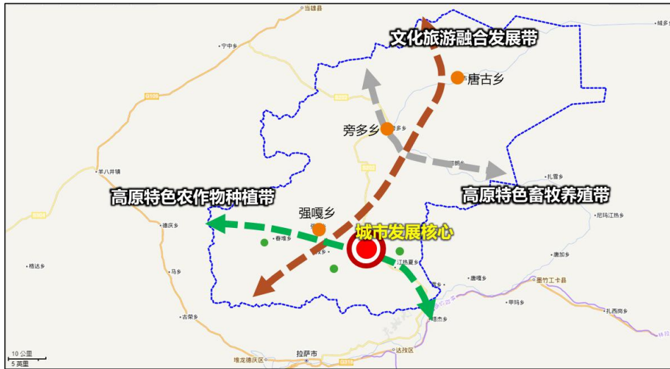
图 1：林周县“一心三带多点”空间格局示意图